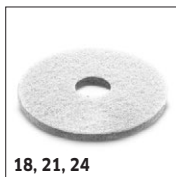
18, 21, 24