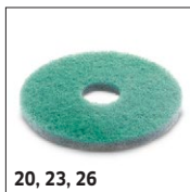
20, 23, 26