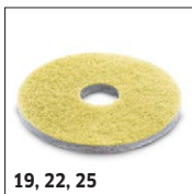
19, 22, 25