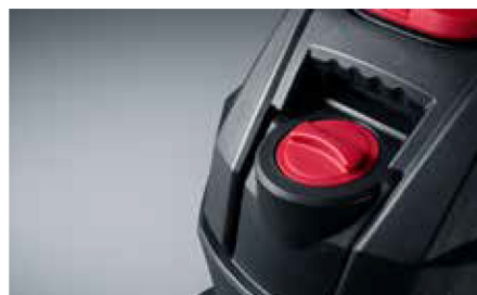
Kényelmes és egyszerű tartályfeltöltés a gép elején lévő nyíláson keresztül