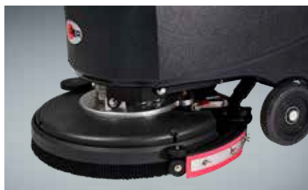
Eszközmentes felszívó fej karbantartás