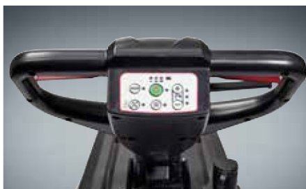
Intuitív kijelző minden funkcióval (kép: AS4325 model)